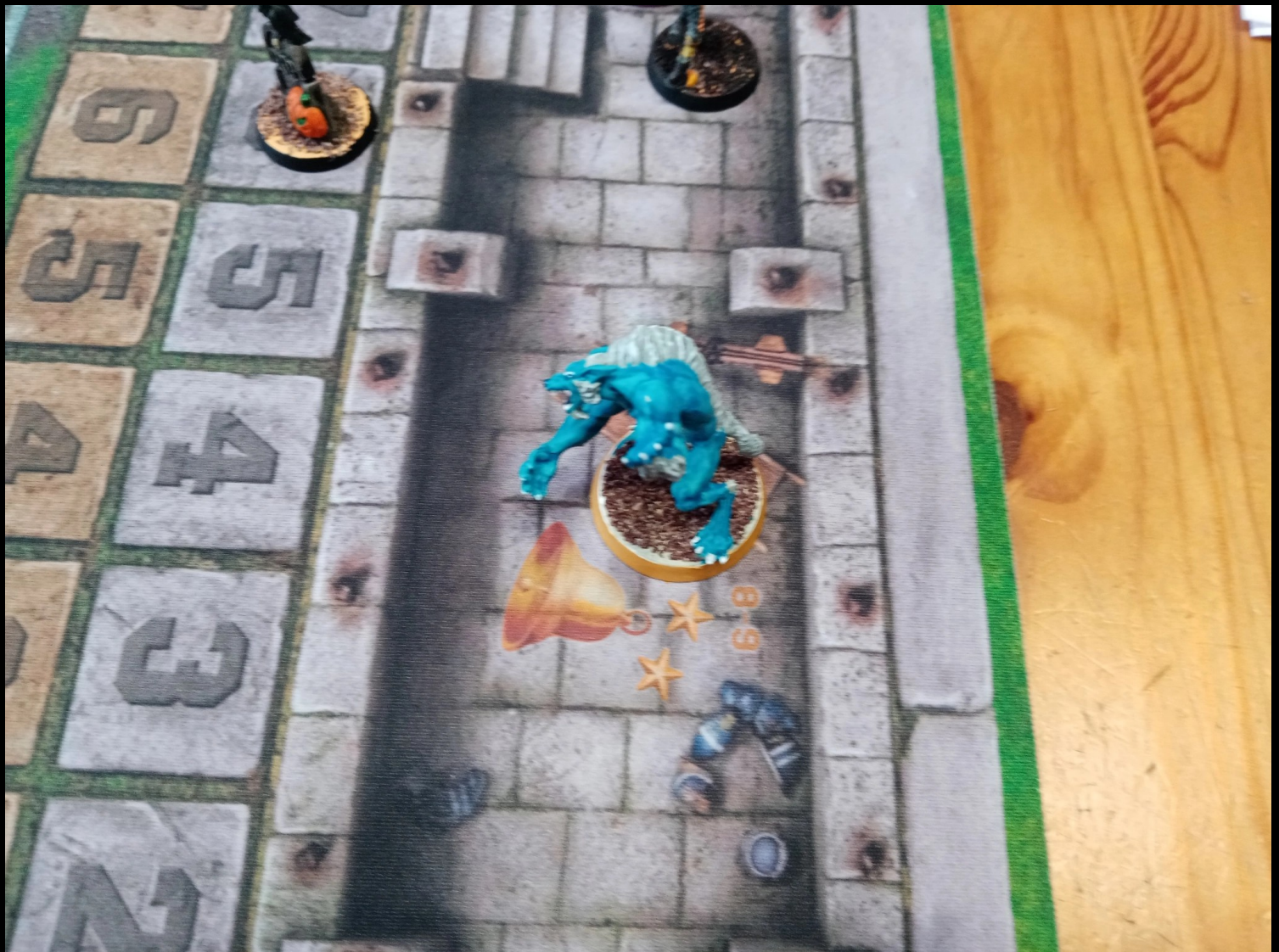
Cheney voit des étoiles